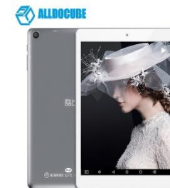
Tablet's win10 8"