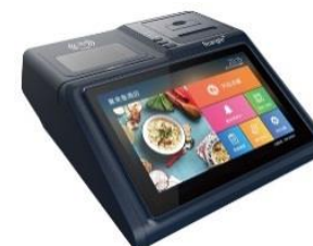
POS Terminal SGT-101